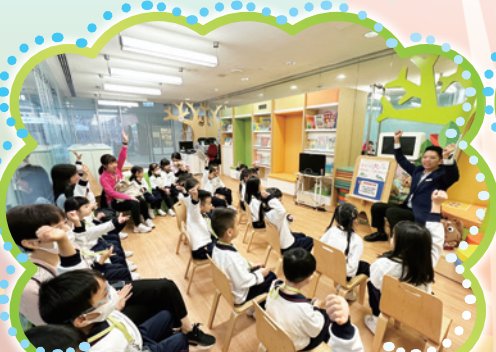
參觀「立法會綜合大樓」