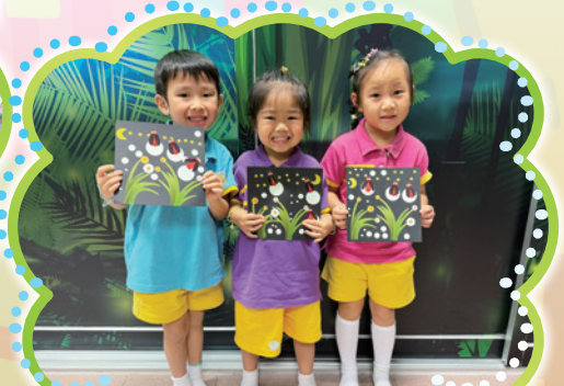
低班參觀螢火蟲繽紛巡禮