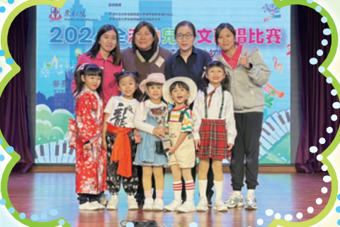
全港幼兒英文歌唱比賽