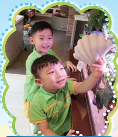
幼兒班參觀「耀學園探索空間」