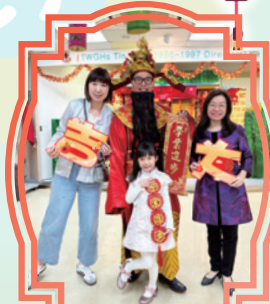
農曆新年親子活動