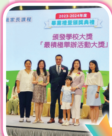
最積極舉辦活動大獎 — 季軍