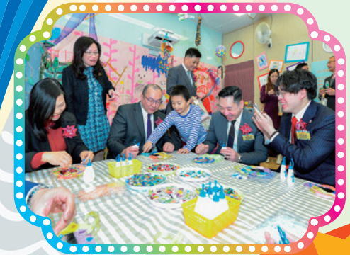
TWGHs Tin Wan (1996-1997 Directors) Kindergarten