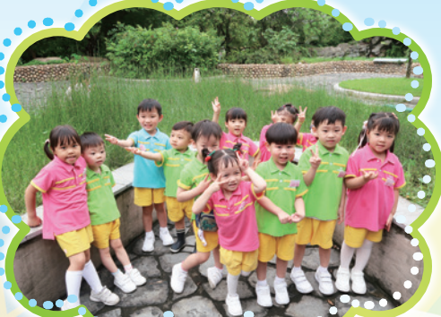
幼兒班參觀香港濕地公園