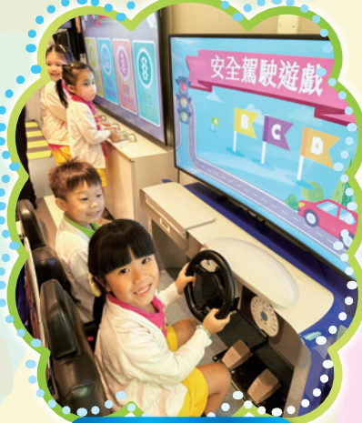
參觀道路安全巴士