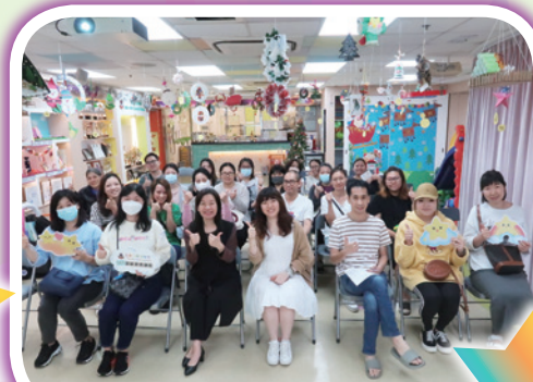
「生氣寶寶不可怕」家長講座