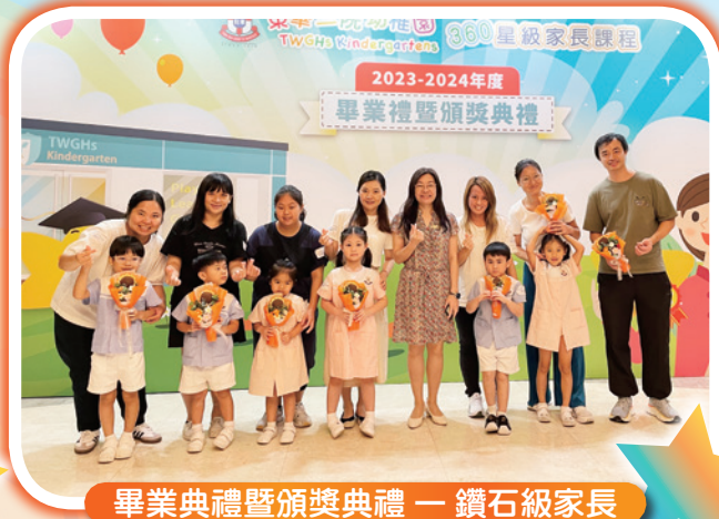
畢業典禮暨頒獎典禮 — 鑽石級家長