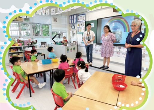
模擬小一課堂活動