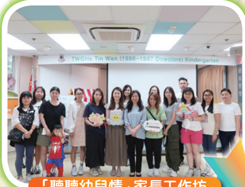
「聽聽幼兒情」家長工作坊